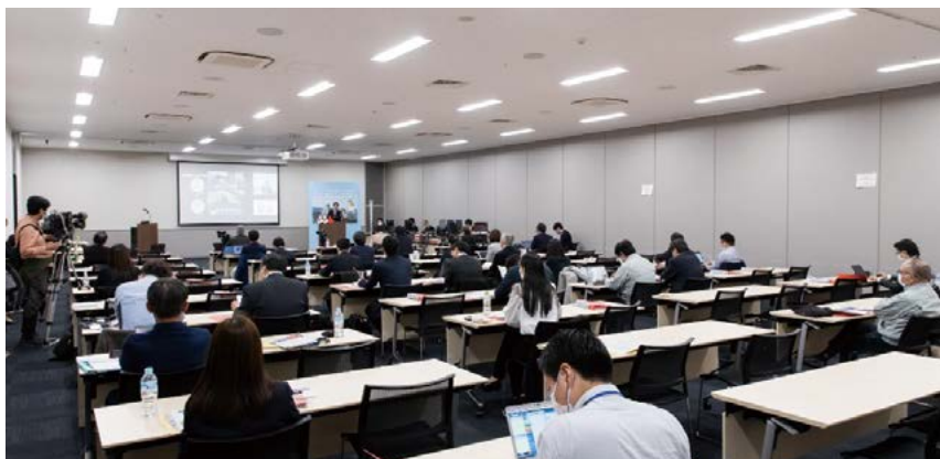
第十九届会议（线上举行）